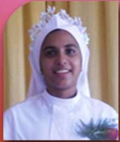
സി. അലീഷ തടത്തിൽപുരയിട ത്തിൽ MSJ