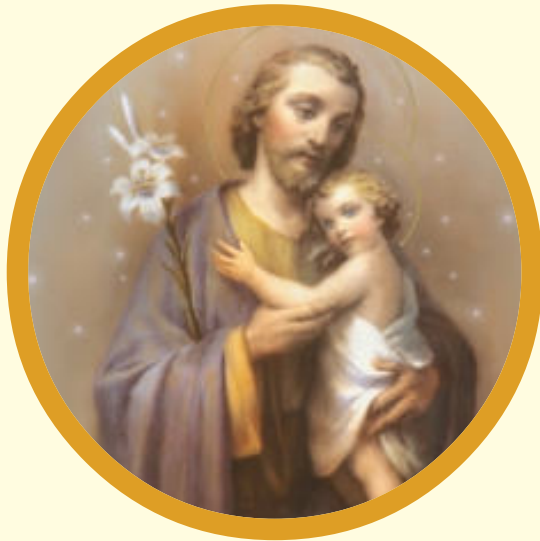
St. Joseph, Pray for us

ഉച്ചകഴിഞ്ഞ്, താമരശ്ശേരി ആരാധനാ സന്യാസിനീ സമൂഹം പുതുതായി പണികഴിപ്പിച്ച വിശ്രമമന്ദിരത്തിന്റെ കപ്പേള കൂദാശകർമ്മം നടത്തുകയും ഭവനം വെഞ്ചരിച്ച് വി. കുർബാന അർപ്പിക്കുകയും ചെയ്തു.