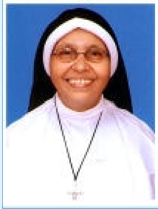
സി. ഡാമിയൻ എഫ്.സി.സി