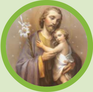
St. Joseph, Pray for us