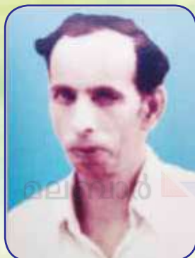
ദേവസ്യ മലേക്കുന്നേൽ കണ്ണോത്ത്