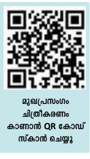
മുഖപ്രസംഗം ചിത്രീകരണം കാണാൻ QR കോഡ് സ്കാൻ ചെയ്യൂ

പിറവിത്തീർന്നാളിന് ഒരുങ്ങുന്ന നമുക്ക് പരിശുദ്ധ മറിയവും യൗസേപ്പിതാവും മാതൃകയാകണം. തങ്ങളുടെ ജീവിതത്തെ കീഴ്മേൽ മറിക്കുന്ന സഹനങ്ങളെ മറിയവും യൗസേപ്പിതാവും അനുഗ്രഹമാക്കിയത് ധീരതയോടെ ദൈവിക പദ്ധതിയുടെ മുൻപിൽ ശിരസുമിടിച്ചാണ്. യുദ്ധങ്ങളും കെടുതികളും അക്രമണങ്ങളും വർദ്ധിച്ചു വരുന്ന ഈ ദിനങ്ങളിൽ നമ്മുടെ മുഖപോട്ടാനുള്ള മണ്ണ് നമ്മുടെ ഒരുക്കി കൊടുക്കാം. നമ്മുടെ പരിപോഷിപ്പിച്ച് സന്താനങ്ങളുളളവരുടെ ഇടം ഒരുക്കാം.