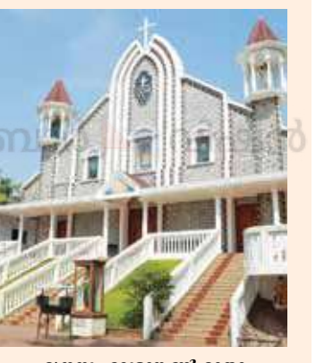
മുനമ്പം വേളാങ്കണ്ണി മാതാ ദൈവാലയം.

2014-ൽ ഡൽഹിയിൽ ഏറ്റവും വിലയേറിയ 123 വസ്തുവകകളാണ് കേന്ദ്ര സർക്കാർ വഖഫ് ബോർഡിനു കൊടുത്തത്. ചെറായി- മുനമ്പം തീരദേശത്ത് താമസിക്കുന്ന 600-ൽ പരം കുടുംബങ്ങളുടെ ജീവിതം 2019 മുതൽ നിശ്ചലമാക്കിയിട്ടിരിക്കുകയാണ് കേരള വഖഫ് ബോർഡ്. മുനമ്പം വേളാങ്കണ്ണി മാതാ ഇടവക ദൈവാലയത്തിനുമേലും പാഷനിസ്റ്റ് ആശ്രമത്തിനുമേലും വഖഫ് ബോർഡിന്റെ അവകാശവാദമെന്ന ഡമോക്ലിസിന്റെ വാൾ തൂങ്ങിക്കിടക്കുകയാണ്.