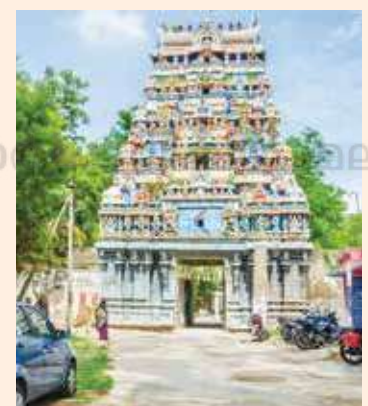
വഖഫ് ബോർഡ് അവകാശവാദം ഉന്നയിച്ച തമിഴ്നാട്ടിലെ തിരുച്ചെന്തൂരൈ സുന്ദരേശ്വരൻ ക്ഷേത്രം

2014-ൽ ഡൽഹിയിൽ ഏറ്റവും വിലയേറിയ 123 വസ്തുവകകളാണ് കേന്ദ്ര സർക്കാർ വഖഫ് ബോർഡിനു കൊടുത്തത്. ചെറായി- മുനമ്പം തീരദേശത്ത് താമസിക്കുന്ന 600-ൽ പരം കുടുംബങ്ങളുടെ ജീവിതം 2019 മുതൽ നിശ്ചലമാക്കിയിട്ടിരിക്കുകയാണ് കേരള വഖഫ് ബോർഡ്. മുനമ്പം വേളാങ്കണ്ണി മാതാ ഇടവക ദൈവാലയത്തിനുമേലും പാഷനിസ്റ്റ് ആശ്രമത്തിനുമേലും വഖഫ് ബോർഡിന്റെ അവകാശവാദമെന്ന ഡമോക്ലിസിന്റെ വാൾ തൂങ്ങിക്കിടക്കുകയാണ്.