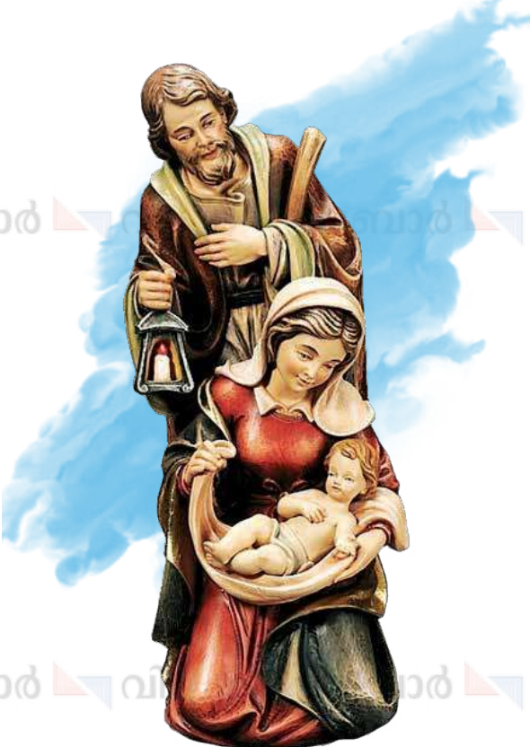
ടുക്കുന്നതല്ല. പ്രത്യേക അത് ഉന്നതവും ശ്രേഷ്ഠവുമായ ദൈവദാനമാണ്.

ദൈവത്തിന് മനുഷ്യനോടുള്ള അദൃശ്യമായ സ്നേഹമാണ് മനുഷ്യമഹത്വത്തിന്റെ ഉറവിടവും അടിസ്ഥാനവും (Dignitas infinita, 18). തന്റെ ഏകജാതനെ നൽകത്തക്കവിധം ദൈവം ലോകത്തെ അത്രമാത്രം സ്നേഹിച്ചു (1 യോഹ. 3: 9-10, യോഹ. 3:16). തന്റെ ഛായയിലും സാദൃശ്യത്തിലും ദൈവം മനുഷ്യനെ സൃഷ്ടിച്ചത് (ഉൽപ. 1:26) ഈ സ്നേഹത്തിന്റെ ഉന്നതമായ പ്രകാശനമാണ്. തന്റെ മനുഷ്യാവതാരത്തിലൂടെ യേശു തന്നെതന്നെ മനുഷ്യരായിരുന്നതായി താദാത്മ്യപ്പെടുത്തി. അപ്രകാരം മനുഷ്യനായി ജന്മം പ്രാപിച്ചതിലൂടെ ഒരിക്കലും നഷ്ടപ്പെടുത്താൻ കഴിയാത്ത അപരിമേയമായ മഹത്വത്തിന് ഉടമയാണ് മനുഷ്യൻ എന്ന് യേശു പ്രഖ്യാപിക്കുകയാണ്. ഈ മഹത്വം മനുഷ്യൻ നേടിയെ