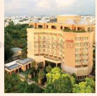
വഖഫ് ബോർഡ് അവകാശവാദം ഉന്നയിച്ച ഹൈദരാബാദിലെ മാരിയറ്റ് ഹോട്ടൽ

വഖഫ് വസ്തുക്കളും വഖഫ് ഭൂമിയും സംബന്ധിച്ച അഴിമതി വിവാദങ്ങളും നിരവധി. മറ്റുള്ളവരുടെ വസ്തുക്കളുടെമേലും ഭൂമിയുടെയും മേൽ അവകാശധികാരങ്ങൾ ഉന്നയിച്ചും വഖഫ് വസ്തുവകകൾ ദുരുപയോഗം ചെയ്തും അതിരില്ലാത്ത അധികാരപ്രയോഗം നടത്തിയും തുടരത്തുടരെ വിവാദമുണ്ടാക്കുന്ന വഖഫ് ബോർഡിനെ വേണ്ടവിധം ഭരണഘടനയുടെ വരുതിക്ക് നിർത്തേണ്ടതിന്റെ ആവശ്യകത ഇസ്ലാം വിശ്വാസികളിൽ പോലും പലർക്കും ബോധ്യപ്പെട്ടിട്ടുണ്ട്.