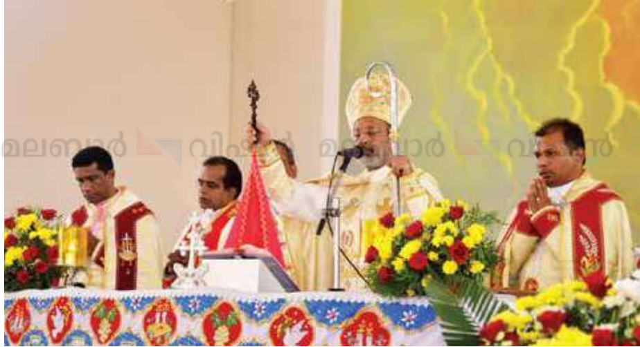
ബഥാനിയായിൽ നടന്ന അവൺഡ് ജപമാല സമർപ്പണ സമാപനത്തിൽ നിന്ന്

2023-24 പ്രവർത്തന വർഷത്തിൽ എ പ്ലസ് ഗ്രേഡ് നേടിയ ശാഖകൾ: കുരാച്ചുണ്ട്, ഈങ്ങാപ്പുഴ, കോടഞ്ചേരി, കല്ലാനോട്, വലിയകൊല്ലി, തിരുവമ്പാടി, കണ്ണോത്ത്, കരുവാരകുണ്ട്, ചക്കിട്ടപാറ.