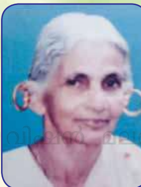
അനമ്മ ദേവസ്യ മലേക്കുന്നേൽ