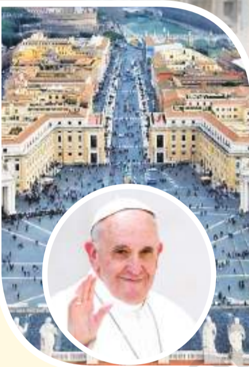
ഫ്രാൻസിസ് മാർപാപ്പയെ കാണാൻ അപൂർവ അവസരം!!!