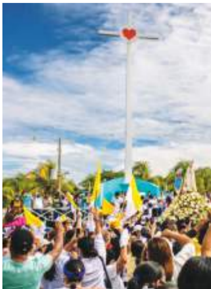
പ്രദക്ഷിണത്തിന് പൊലീസ് അനുമതി നിഷേധിച്ചതിനെ തുടർന്ന് മനാഗയിൽ കത്തോലിക്കർ നടത്തിയ പ്രാർത്ഥനാ പടങ്ങിൽ ഒത്തുകൂടിയവർ