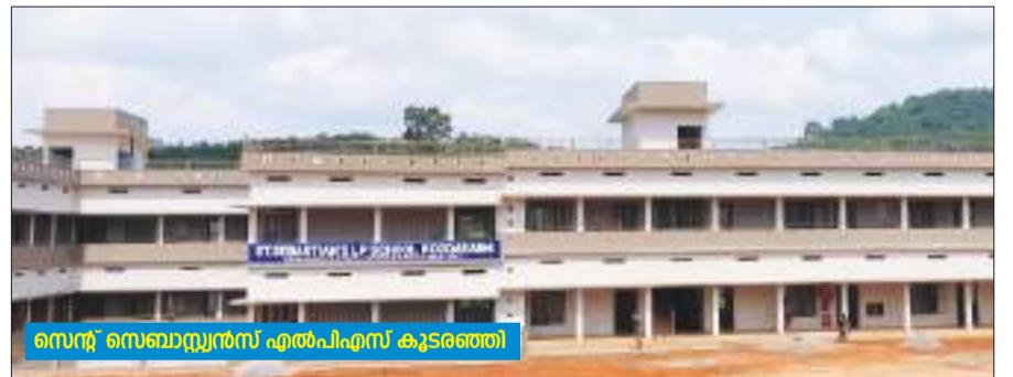
സെന്റ് സെബാസ്റ്റ്യൻസ് എൽപിഎസ് കൂടരഞ്ഞി