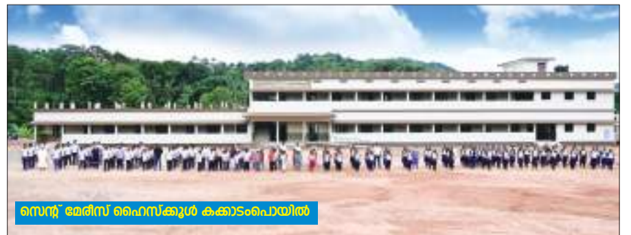
സെന്റ് മേരീസ് ഹൈസ്കൂൾ കക്കാടപൊയിൽ