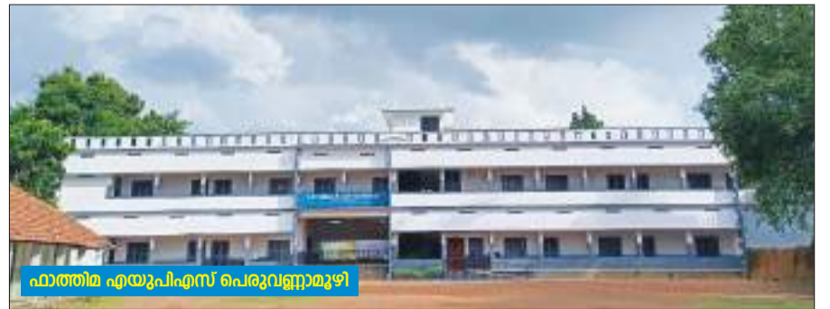
ഫാത്തിമ എയുപിഎസ് പെരുവണ്ണാമുഴി