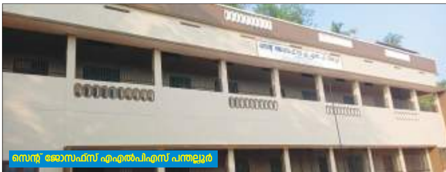
സെന്റ് ജോസഫ്സ് എൽപിഎസ് പന്തല്ലൂർ