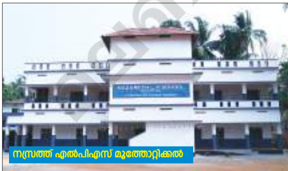
നസ്രത്ത് എൽപിഎസ് മുത്തോറ്റിക്കൽ

കോർപ്പറേറ്റ് എഡ്യൂക്കേഷണൽ ഏജൻസിയുടെ പുതുതായി നിർമ്മാണം പൂർത്തിയാക്കിയ സ്കൂൾ കെട്ടിടങ്ങൾ