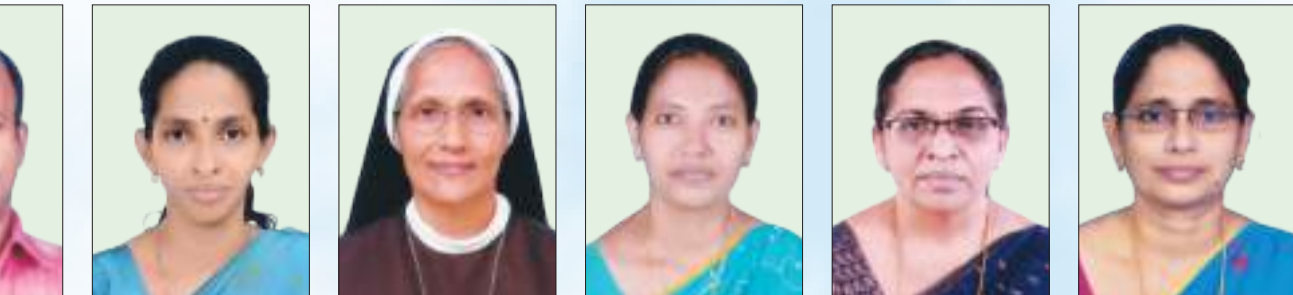
ജിമോൾ കെ. ഹൈസ്കൂൾ/സെന്റ് കോടത്തേരി L.P.S