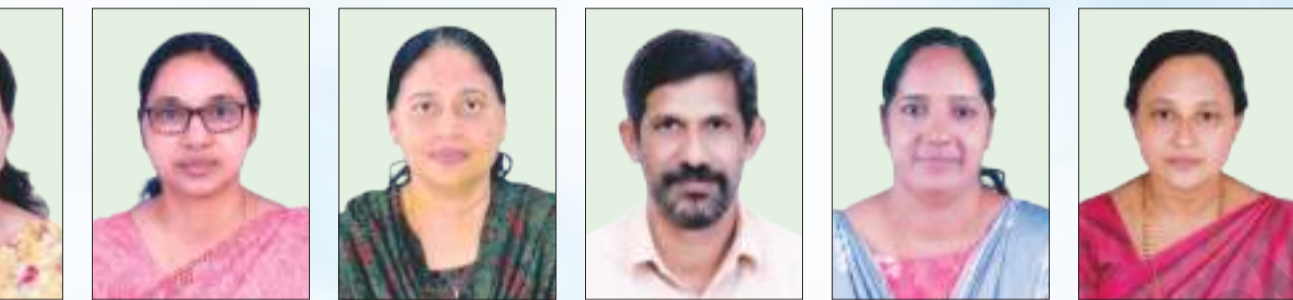
ഷേർളി മാത്യു എച്ച്.എസ്.എസ്.ടി. വേനംഗം H.S.S