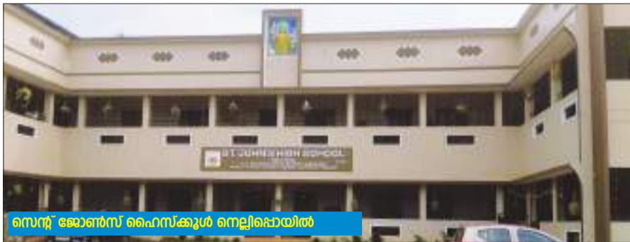
സെന്റ് ജോൺസ് ഹൈസ്കൂൾ നെല്ലിപ്പൊയിൽ