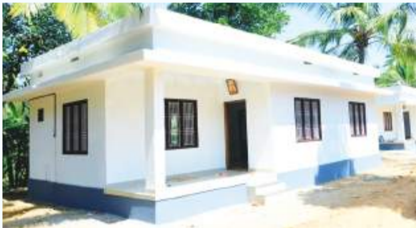
താമരശ്ശേരി രൂപത വിലങ്ങാട് നിർമ്മിച്ചു നൽകിയ കാരുണ്യ ഭവൻ വീടുകളിലൊന്ന്