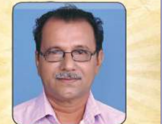
വി. ഡി പൗലോസ് വെള്ളപ്പാക്കൽ, വേനപ്പാറ മരിച്ച വിദ്യാർത്ഥികളുടെ ആത്മാക്കൾക്ക് മണ്ണുറപ്പ് മനോഹരണത്തോടെ മോക്ഷത്തിൽ കേരവാൻ ഇടയാക്കണമേ. പ്രാർത്ഥനയ്ക്കുവേണ്ടി കൂടുംതോട്ടംഗ്രൂപ്പ്