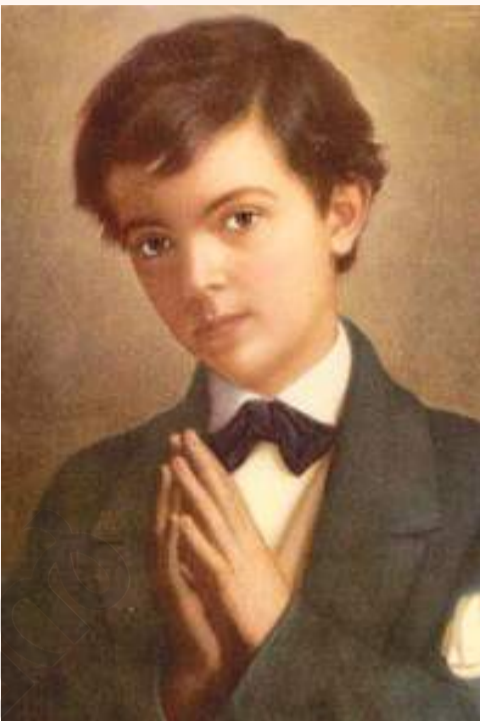
വിശുദ്ധ ഡൊമിനിക്കിൻ സാവിത്രോ

ഞ്ഞേ ആ യജമാനൻ?” “അതറിയില്ലേ, നമ്മുടെ നല്ല ദൈവം തന്നെ” വളരെ സന്തോഷത്തോടെ അവൻ മറുപടി നൽകി. സ്കൂളിലേക്ക് പോകും വഴി ഉണ്ണിശോയെയും കാവൽമാലാഖയെയും പരിശുദ്ധ അമ്മയെയും കുട്ടിനു വിളിച്ചുകൊണ്ട് അവരുടെ കൂടെ കൊച്ചു കൊച്ചു സംഭാഷണങ്ങളിൽ ഏർപ്പെട്ടുകൊണ്ടു പോകുമായിരുന്ന നമ്മുടെ കൊച്ചു ഡൊമിനിക്കിൻ. കുട്ടുകാരെ നമുക്കും ഇവരെ കുട്ടുപിടിച്ചാലോ? ഉണ്ണിശോയോടും കാവൽമാലാഖയോടും സംസാരിക്കാറുണ്ടോ? ഇല്ലെങ്കിൽ ഇന്നു മുതൽ ആരംഭിക്കണം കേട്ടോ, എല്ലാ കാര്യങ്ങളും അവരോടൊന്ന് പറഞ്ഞു തുടങ്ങാം, ഒരു കുട്ടുകാരനോട് പറയുന്നത് പോലെ. അങ്ങനെ ഈശോയുടെ കൂടെ നടക്കുമ്പോഴാണ് ഒരു പുരോഹിതൻ രോഗികൾക്കായി ദിവ്യകാരുണ്യം എഴുന്നള്ളിച്ചുകൊണ്ടു പോകുന്നത് നമ്മുടെ കൊച്ചു ഡൊമിനിക്കിൻ കണ്ടത്. ഉടനെ അവൻ എന്തു ചെയ്തെന്നോ? റോഡിന്റെ സൈഡിൽ മുട്ടുകുത്തി. അവന്റെ വസ്ത്രത്തിൽ ഇത്തിരി ചെളി പൂർണ്ണ. ഇതുകണ്ട് അവന്റെ സുഹൃത്ത് അവനോട് പറഞ്ഞു. നീ ഇങ്ങനെ മുട്ടുകുത്തി വസ്ത്രത്തിൽ ചെളിപൂർണ്ണമാണ് ഇടയാക്കേണ്ടതില്ല. ദൈവം അത് നിന്നിൽ നിന്ന് ആവശ്യപ്പെടുന്നില്ല; ഉടൻ ഡൊമിനിക്കിൻ പറഞ്ഞു; കാൽമുട്ടും വസ്ത്രവും നൽകിയത് ദൈവമല്ലേ. അവിടുത്തെ മഹത്വത്തിനും ശുശ്രൂഷയ്ക്കുമായി അവയെ ഉപയോഗിക്കേണ്ടതല്ലേയോ? ഈശോ കടന്നുപോകുമ്പോൾ അവിടുത്തെക്ക് മഹത്വം നൽകാനായി എന്തെ ചെയ്തിട്ടുണ്ടിടേക്ക് എറിഞ്ഞാലേന്ത്? എന്തെ ഒരു തീച്ചുളളയിലേക്ക് എറിഞ്ഞാൽ, ഈ ദിവ്യകാരുണ്യത്തിൽ അവിടുന്ന് പ്രകടിപ്പിക്കുന്ന സ്നേഹത്തിന്റെ ഒരു തരി എനിക്കു കിട്ടുമെങ്കിൽ ഞാൻ അങ്ങനെ തന്നെ ചെയ്യും.