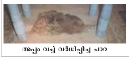
അപ്പം വെച്ച് വർധിച്ച പാറ

വെള്ളത്തിൽ കാലുറപ്പിച്ച് നിൽക്കാനും വെള്ളം കോരിയെടുക്കാനും സാധിക്കും. താബ്ഗാ: പരമാധികാരത്തിന്റെ പള്ളിയോട് ചേർന്ന് കിടക്കുന്ന അടുത്ത പുണ്യസ്ഥാനമാണ് താബ്ഗാ. തടാകതീരത്തു സ്ഥിതിചെയ്യുന്ന ഈ സ്ഥാനത്തുവെച്ചാണ് കർത്താവ്, അഞ്ചപ്പവും രണ്ട് മീനും വർധിപ്പിച്ച്. സ്ത്രീകളും കുട്ടികളും ഒഴികെ, അയ്യായിരത്തോളം പുരുഷന്മാർക്ക് നൽകിയത്. പുരുഷന്മാരോടൊരുമിച്ച് സ്ത്രീകളും കുട്ടികളുംകൂടി ചേരുമ്പോൾ എത്ര ആയിരമെന്ന് നമുക്ക് ഊഹിച്ചെടുക്കാവുന്നതാണ്. (മത്താ 14/1321) മർക്കോ. 6/3044, ലൂക്കാ 9/1017, യോഹ.6/113) നാല് സുവിശേഷകന്മാരും ഈ സംഭവം വിവരിക്കുന്നുണ്ട്. ഈ സ്ഥാനത്തിന് താബ്ഗാ എന്നാണ് പേര്. 7 നീരുറവകളാണ് ഇവിടെനിന്ന് പൊട്ടിപ്പുറപ്പെട്ട് വെള്ളം തടാകത്തിലേക്ക് ഒഴുകുന്നത്. ഈ സ്ഥാനത്ത് ബെനഡിക്റ്റൻ സന്യാസിമാരുടെ ഒരു ദേവാലയം പണിചെയ്യപ്പെട്ടിരിക്കുന്നു. അതിന്റെ പ്രധാന അൾത്താരയുടെ ചുവട്ടിലായി, ഈശോ അപ്പം വെച്ച് ആശീർവദിച്ച പാറയുടെ ഭാഗവും കാണാം. ഒപ്പം, നിലത്ത് രണ്ട് മത്സ്യങ്ങളും ഒരു അപ്പകൂട്ടയുടേതുമായ ഒരു മൊസയിക്ക് ചിത്രവും സ്ഥാപിച്ചിരിക്കുന്നു. താബ്ഗാ എന്ന പദം 7 നീരുറവകൾ എന്ന ഗ്രീക്ക് പദം ലോപിച്ചുണ്ടായതാണ്.