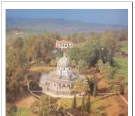
അഷ്ട സൗഭാഗ്യങ്ങളുടെ മലയും പള്ളിയും

പരമാധികാര പള്ളിയുടെയും, താബ്ഗായുടെയും വടക്ക് ഭാഗത്ത് ഉയർന്നുനിൽക്കുന്ന മലയാണ്, അഷ്ടസൗഭാഗ്യങ്ങളുടെ മല. ഈശോ വലിയ ജനക്കൂട്ടത്തെ കണ്ടപ്പോൾ മലയിലേക്ക് കയറി. ജനമെല്ലാം അവിടേക്ക് ചെന്നു. മലമുകളിലിരുന്ന്, ഈശോ നൽകിയ അഷ്ടസൗഭാഗ്യങ്ങൾകൊ