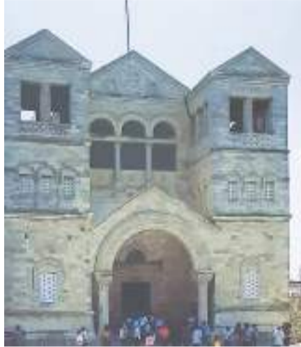
താബോറിലെ 3 കുടാരങ്ങളുടെ ബസിലിക്ക

ത്ത് റോഡിൽ വലിയൊരു വളച്ച് വാതിൽ പണുതുയർത്തിയിട്ടുണ്ട്. അതിന്മേൽ വലിയ അക്ഷരത്തിൽ കാനായിലേക്ക് സ്വാഗതം (Welcome to cana) എന്ന് എഴുതിയിരിക്കുന്നു. ആ വാതിൽ കടക്കുമ്പോൾ, കാനായിലെ നല്ലവരായ നഗരവാസികൾ തീർത്ഥാടകരെല്ലാം സന്തോഷത്തോടും സ്നേഹത്തോടുകൂടി സ്വീകരിക്കുന്ന പ്രതിതിയാണ് മനസിലുയരുക.