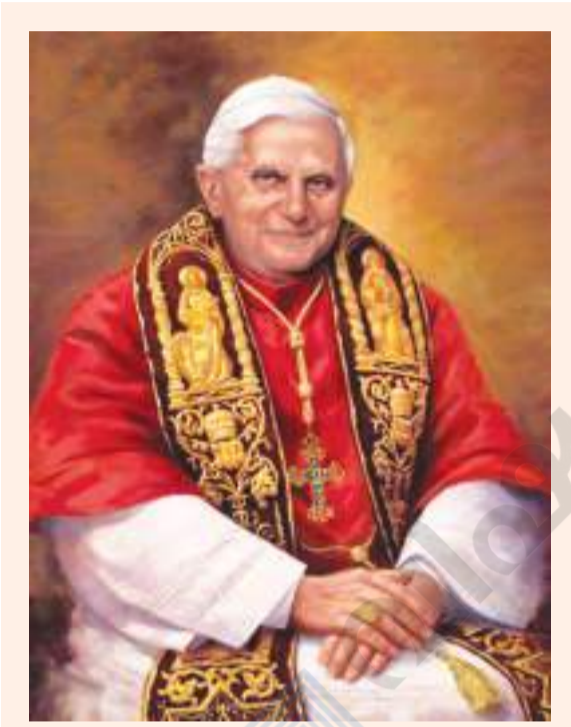
മഹാനായ ജോൺ പോൾ രണ്ടാമൻ പാപ്പയുടെ പിൻഗാമി ആരെന്ന ചോദ്യത്തിന് കർദ്ദിനാൾ തിരുസംഘത്തിനു യുക്ത്യാധിഷ്ഠിത അന്വേഷണനിരീക്ഷണങ്ങളിൽ നിന്നും ലഭിച്ച ഉത്തരം: ആഴമേറിയ പഠനങ്ങളും ആർജ്ജിച്ചെടുത്ത ധൈര്യപരമായ പ്രവൃത്തികളും, ക്രിസ്തു ദർശനങ്ങളുടെ ഉറപ്പുള്ള പാറയിൽ അടിസ്ഥാനമിട്ട വിശ്വാസ ജീവിതവും, ഒരുപോലെ പരിലസിച്ച കർദ്ദിനാൾ ജോസഫ് അലോഷ്യസ് റാറ്റ്സിംഗർ - ബൈബിളിക്സ് പതിനാറാമൻ മാർപാപ്പ

മഹാനായ ജോൺ പോൾ രണ്ടാമൻ പാപ്പയുടെ പിൻഗാമി ആരെന്ന ചോദ്യത്തിന് കർദ്ദിനാൾ തിരുസംഘത്തിനു യുക്ത്യാധിഷ്ഠിത അന്വേഷണനിരീക്ഷണങ്ങളിൽ നിന്നും, ആഴമേറിയ പഠനങ്ങളും ആർജ്ജിച്ചെടുത്ത ധൈര്യപരമായ പ്രവൃത്തികളും, ക്രിസ്തു ദർശനങ്ങളുടെ ഉറപ്പുള്ള