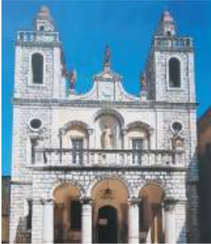
കാനായിലെ അത്ഭുതം നടന്ന പള്ളി

കാനായിലെ കല്യാണവിരുന്നിലെ അത്ഭുതത്തെപ്പറ്റി നാം ഒത്തിരിയേറെ കേട്ടിട്ടുണ്ട്, വായിച്ചിട്ടുണ്ട്, ധ്യാനിച്ചിട്ടുണ്ട്. ഗലീലായിലെ പട്ടണമായ നസ്രത്തിൽ നിന്ന് 7 കിലോമീറ്റർ കിഴക്കായി സ്ഥിതി ചെയ്യുന്ന ഒരു കൊച്ചു പട്ടണമായിരുന്നു കാനാ. അറബിയിൽ ഈ പട്ടണം അറിയപ്പെടുന്നത് കഥർ കാനാ എന്ന പേരിലാണ്. 7000 തോളം വരുന്ന സ്ഥലവാസികളിൽ മൂന്നിലൊരു ഭാഗം മുസ്ലീമുകളും ബാക്കി അറബി ക്രിസ്ത്യാനികളുമാണ്. നസ്രസ്സ് കഴിഞ്ഞാൽ വിശുദ്ധ നാട്ടിലെ രണ്ടാമത്തെ പട്ടണമാണ് കാനാ. പട്ടണത്തിലേക്കുള്ള പ്രവേശനഭാഗം