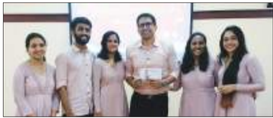
ഇൻഫന്റ് ജീസസ് ചർച്ച് അശോകപുരം

താമരശ്ശേരി രൂപതാ മുഖപത്രം മലബാർ വിഷനും മിഷൻ ലീഗ് രൂപതാ സമിതിയും സംയുക്തമായി സംഘടിപ്പിച്ച കരോൾ ഗാനമത്സരത്തിലെ വിജയികൾ