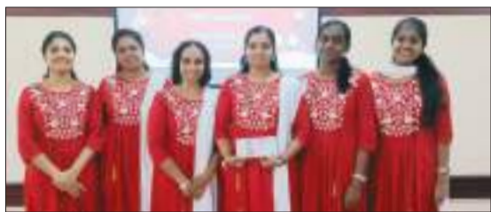
ഫാത്തിമ മാതാ ചർച്ച് ഈസ്റ്റ് ഹിൽ