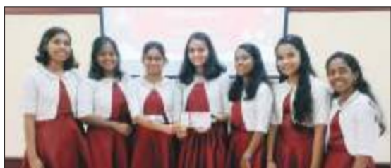
ഫാത്തിമ മാതാ ചർച്ച് മരിയാപുരം

പ്രോത്സാഹന സമ്മാനം: സെന്റ് മേരീസ് ചർച്ച് മഞ്ഞക്കടവ്, സെന്റ് ആന്റണീസ് ചർച്ച് പാറോപ്പടി