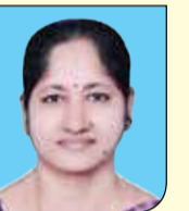
റോജ കാപ്പൻ വിളക്കാത്തോട് LPS