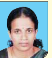
ബാസിലി വടക്കൂട്ട് കരിങ്ങാട് LPS