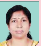
പ്രസീത സി. കട്ടിപ്പാറ HS