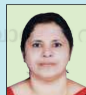
ലിസിമോൾ ഡൊമിനിക് പരിയാപുരം UPS