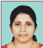
ട്രോയമ്മ വി. തിരുവനാടി HS