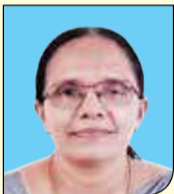
ജെസി കെ. യു. പുഷ്പഗിരി UPS