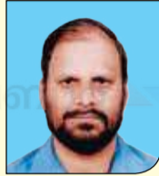
ആന്റണി കെ. ജെ. പുല്ലൂരംപാറ HSS