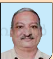
ബെന്നി കെ. കെ. മരയാട്ടി HS