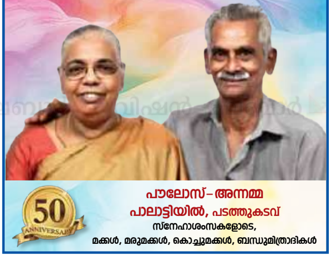
പാലോസ്-അനമ്മ പാലാട്ടിയിൽ, പടത്തുകുടവ സന്തോഷംസകളോടെ, മക്കൾ, മരുമക്കൾ, കൊച്ചുമക്കൾ, ബന്ധുമിത്രാദികൾ