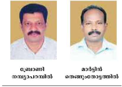
ബ്രോണി നമ്പ്യാപറമ്പിൽ മാർട്ടിൻ തെങ്ങോട്ടോട്ടത്തിൽ

വർദ്ധിച്ചുവരുന്ന വന്യമൃഗ ആക്രമണങ്ങളോടുള്ള സർക്കാർ നിസംഗതയ്ക്കെതിരെ യോഗം ശക്തമായ ഭാഷയിൽ പ്രതിഷേധം അറിയിച്ചു. അനുദിനം ജനവാസ മേഖലകളിലുള്ള വന്യമൃഗങ്ങളുടെ സാന്നിധ്യത്തെയും ആക്രമണങ്ങളെയും സർ