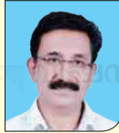
ഷാജി പി. ജെ. കക്കാടംപൊയിൽ HS