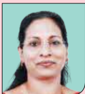
ആൻസി സി. കുരാച്ചുണ്ട് HS