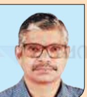
ജോൺസൺ റ്റി. വി. കുണ്ടുതോട് HS